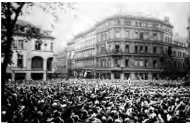
Blick auf den Schillerplatz anlässlich der Übergabe des Osteiner Hofes als Mainzer „Braunes Haus“ an die NSDAP durch die Stadt Mainz am 23.04.1933

Veranstaltende: Verein für Sozialgeschichte Mainz e. V. und Institut für Geschichtliche Landeskunde an der Universität Mainz e. V.