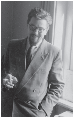
Bernd Alois Zimmermann im Verlagshaus von Schott in Mainz, Oktober 1954

BERND ALOIS ZIMMERMANN ist eine der markantesten deutschen Komponistenpersönlichkeiten des 20. Jahrhunderts. Geboren im Gründungsjahr der Weimarer Republik, hat er wie kaum ein anderer Komponist (nicht nur) seiner Generation die Herausforderungen einer Bestimmung des künstlerischen Standpunktes nach dem Zweiten Weltkrieg kompositorisch wie theoretisch angenommen. Seinem Oeuvre widmet sich das erste musikwissenschaftliche